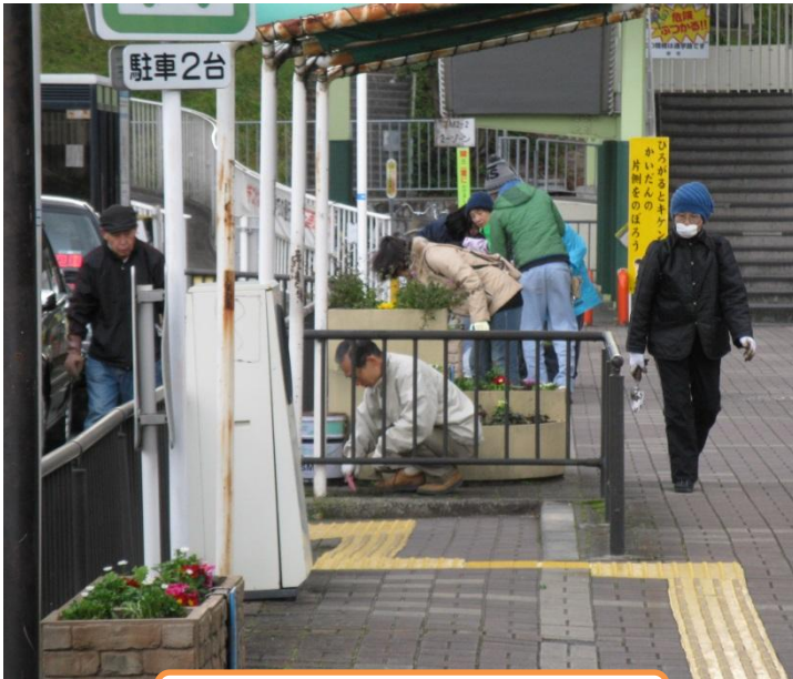
花植えだけではなく草取りも

今年はやはり異常気象なのか、突然の冬将軍が来てしまいました。お正月を迎える花と春に咲く花に入れ替えました。公園協会さんが皆のアイデアを取り入れて菜の花（桃小生徒が育てた苗）、芝桜を用意してくれました。チョットユニーク！雪こそ降らなかったが激寒の中、負けずに仕上げてもらいました。